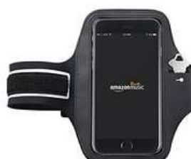
Brassard pour iPhone 6 Plus et iPhone 6s Plus