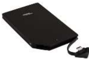
Batterie externe portable ultra-fine