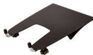
Plateau de maintien pour ordinateur portable