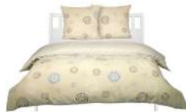
Parure de lit en polycoton, motif floral géométrique